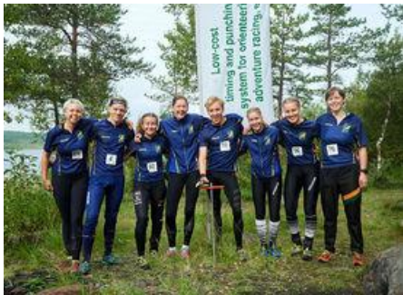
Glada svenska ol-löpare

bästa rent arrangemangsmässigt (en kontroll satt bland annat fel ena dagen) var det väldigt roligt att få den välbekanta tävlingsupplevelsen på ett så annorlunda sätt. Sprinten på söndagen utspelade sig på samma plats och samma karta som tidigare.