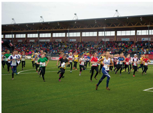
Starten på stafetten

Jag tror att vi alla i klubben hade en trevlig eftermiddag i Boden och utdelningen, förutom nöjet, är att vi fick en intäkt som klarar klubbens alla startavgifter under en säsong.