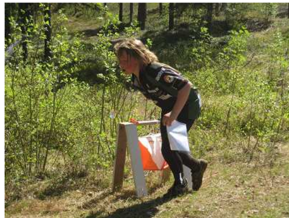
Edit vid sista kontrollen på Polarvåren